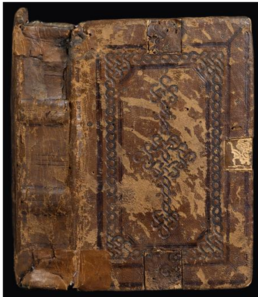
Milano, Archivio Storico Civico e Biblioteca Trivulziana, Cod. Triv. 452 (piatto anteriore e dorso)